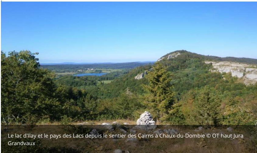
Le lac d'Illay et le pays des Lacs depuis le sentier des Cairns à Chaux-du-Dombief