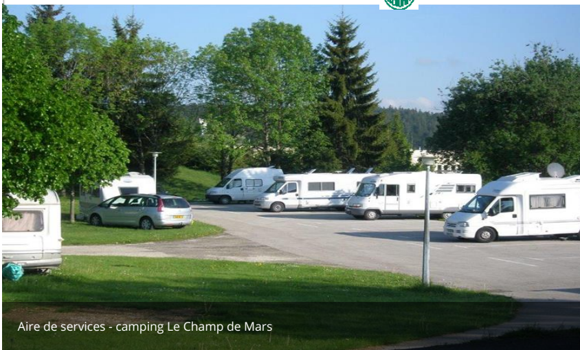
Aire de services - camping Le Champ de Mars